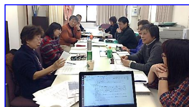
毎月1回全員集まって、それぞれの事業の報告と、課題を持ち寄って、みんなで検討し、より良い解決を目指します。