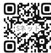
Sネットのホームページへ